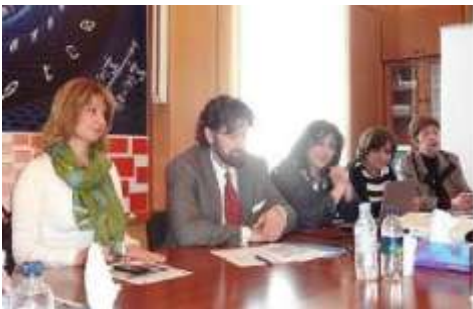
31.03.2015, 1-ին հանդիպում