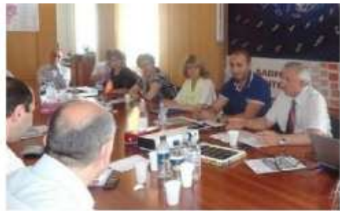
11.06.2015, 2-րդ հանդիպում

3. Մշտապես ծրագրի ղեկավարի, ղեկավարի օգնականի և PR պատասխանատուի կողմից