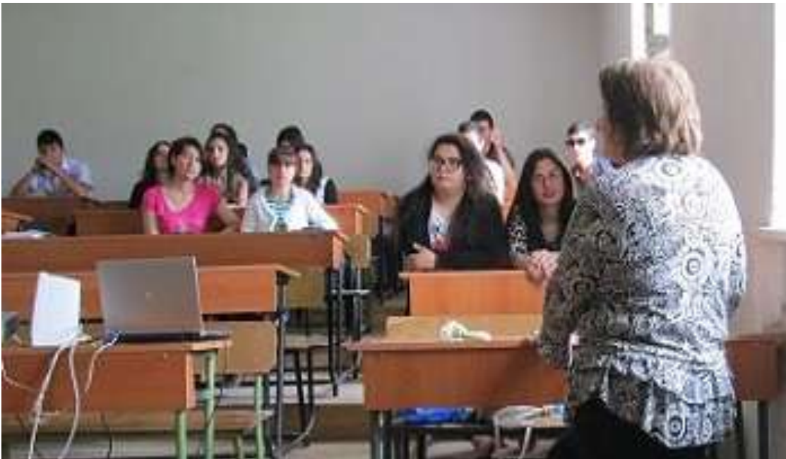
Ստեփանավանի գյուղ քոլեջ, Ստեփանավանի ՕԿ

Համառոտ զրույցից հետո մասնակիցներն իրենք եկան այն եզրահանգման, որ յուրաքանչյուր քաղաքացի, հենվելով Օրհուսի կոնվենցիայի դրույթներին, պետք է ակտիվություն ցուցաբերի շրջակա միջավայրի պահպանության գործում, տեղեկացված լինի, մասնակցություն ցուցաբերի որոշումների կայացմանը: