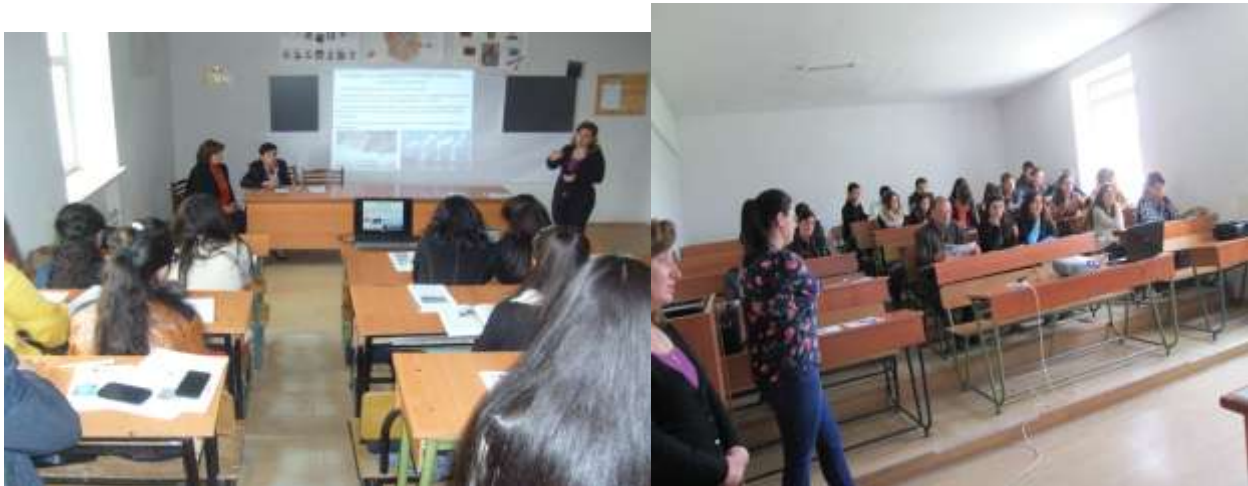
Կարևոր բուսաբանական տարածքների բացահայտում Ստեփանավանում

Ստեփանավանի Օրհուս Կենտրոնը աշխատանք է տարել մարզում առկա բնապահպանական արդյունավետ կառավարման լավագույն փորձի տարածման, կառավարման մարմինների և հասարակության փոխհամագործակցության լավագույն օրինակների ներկայացման ուղղությամբ, առաջարկել քաղաքացիական հասարակության կազմակերպությունների միջև համագործակցության արդյունավետ միջոցներ և մեխանիզմներ՝ ակտիվ համագործակցելով Վանաձորի ,Ալավերդու, Ապարանի Գյումրու և այլ Օրհուս կենտրոնների, կրթական օջախների , հասարակական կազմակերպությունների հետ :