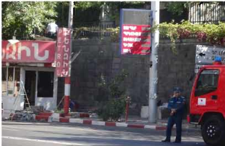
Անտրինական բենզալցակայան ապամոնտաժվեց