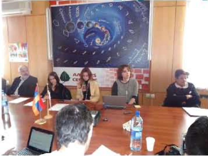
Մթնոլորտային օդի աղտոտվածության վիճակը Երևան քաղաքում