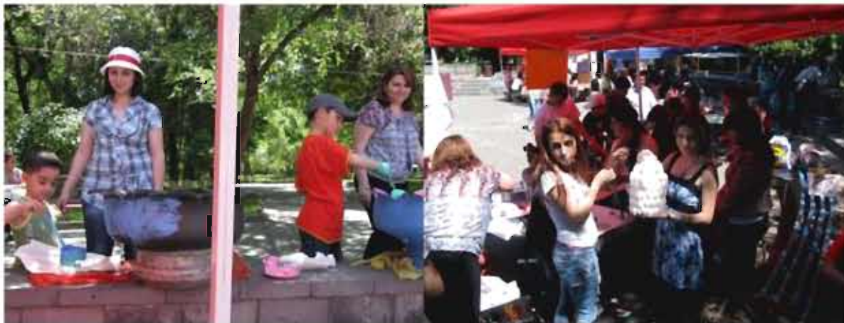
Շրջակա միջավայրի պաշտպանության օրը Երևանի մանկական զբոսայգում