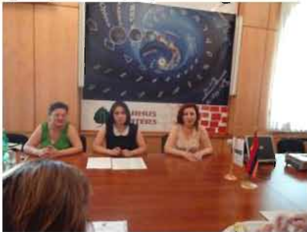
«Նուբարաշենի աղբավայրից կենսագազի օգտահանման ու էլեկտրաէներգիա արտադրելու» նախագծի արդյունավետության վերաբերյալ քննարկում