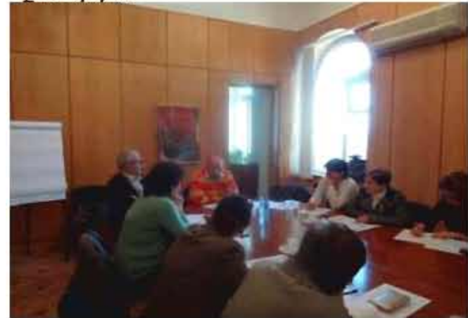
Խաղալիքների անվտանգության հարցերի շուրջ քաղաքացիական հասարակության երկխոսություն