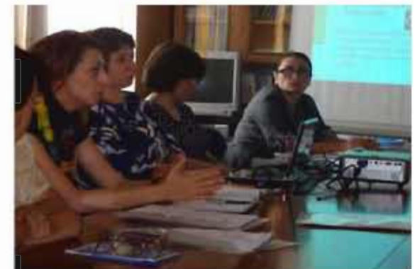
Մտիկի հիմնախնդիրները ՀՀ-ում