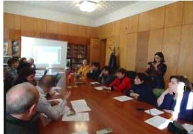
Օրիուսի կոնվենցիայի իրականացման 4-րդ Ազգային զեկույցի հանրային քննարկում