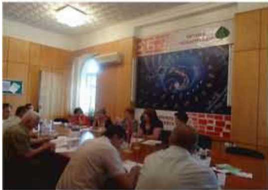
Բնապահպանական և բնօգտագործման վճարների նպատակային օգտագործման խնդիրները ՀՀ-ում