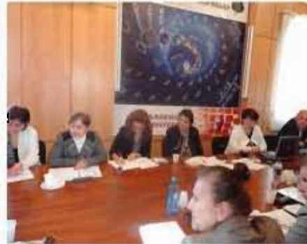
Խաղալիքների անվտանգության հարցերը ՀՀ-ում