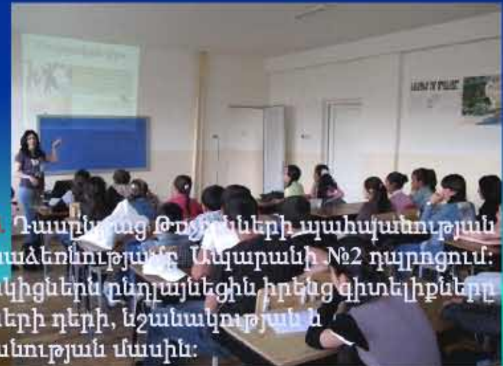
24.05.13. Դասընթաց Թոշիկների պահպանության ՀԿ նախաձեռնությամբ Ապարանի №2 դպրոցում: Մասնակիցներն ընդլայնեցին իրենց գիտելիքները թռչունների դերի, նշանակության և պահպանության մասին: