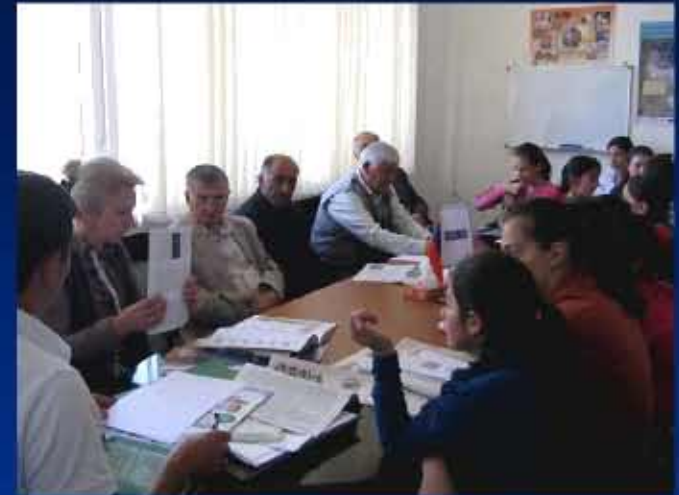
28.05.13. Դասընթաց Ուսուցիչների և աշակերտների, այգեգործությամբ զբաղվող փորձառու բնակիչների մասնակցությամբ. «Կենսաբազմազանության պահպանությունը գյուղական և քաղաքային միջավայրում» թեմայով: