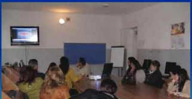
17.04.13. Մեմինար. Ավագ դպր . ուսուցիչների համար. «Հանրաքայունարեքություն. Թուխմանուկի ռիսկերը >> ֆիլմի դիտում-քննարկում: Նպատակը՝ հասարակության լայն շերտերի մասնակցությունը բնապահպանության հարցերում, համայնքների, հասարակության լայն խավերի փոխհամաձայնեցված, գործունեության ապահովում.

«Խաղալիքների անվտանգության հարցերի շուրջ քաղաքացիական հասարակության երկխոսություն»>> թեմայով: Նպատակը՝ «Հայ կանայք հանուն » ՀԿ-ի կողմից իրականացվող «Թույներից ազատ խաղալիքներ» ծրագրի հետազոտությունների արդյունքների ներկայացում Ապարանի մանկապարտեզների ղեկավարներին և կոլեկտիվների անդամներին.