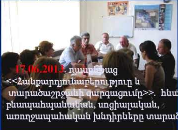
17.06.2013. դասընթաց «Հանրաքայունարեքությունը և տարածաշրջանի զարգացումը»>>. հնարավոր բնապահպանական, սոցիալական, առողջապահական խնդիրները տարածաշրջանում

Շրջակա միջավայրի պահպանության նկատմամբ պատասխանատու վարքագծի ձևավորան գործընթացին խթանելու նպատակով՝ համայնքների բնակչության և համայնքային կազմակերպությունների համար կենտրոնը կազմակերպում և անցկացնում է Էկոկրթական դասընթացներ: