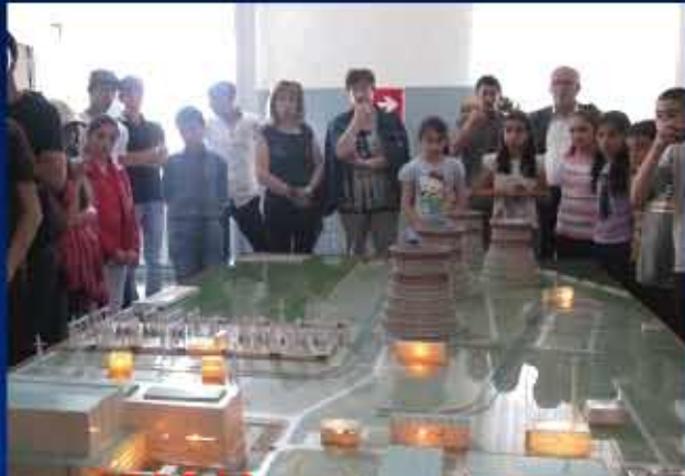
30.05.13. Դասընթաց «Հնայաստանի էներգառեսուրսները» Ապարանի աշակերտների, SPAR խմբակի անդամների, ուսուցիչների համար: ՏԱՊԱՆ ԷԿՈՍԿՈՒՄԲ ՀԿ նախաձեռնությամբ և կենտրոնի աջակցությամբ կազմակերպվեց Էքսկուրսիա Հայկական ԱԷԿ,